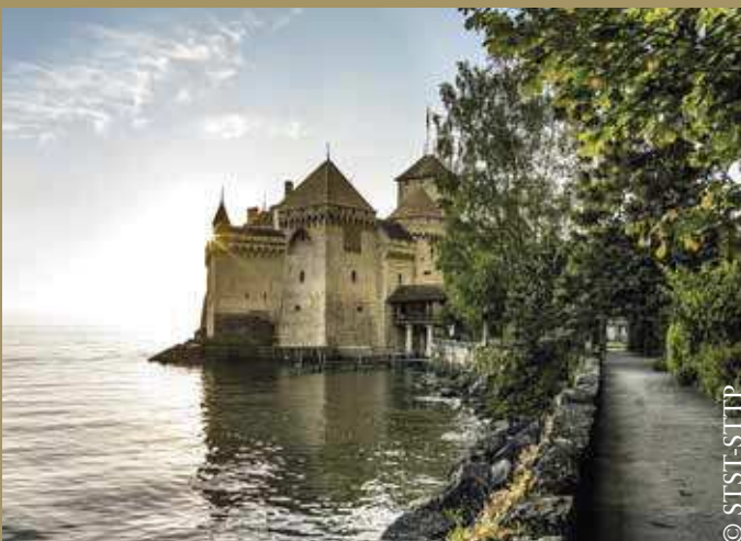
Schloss Chillon, Montreux