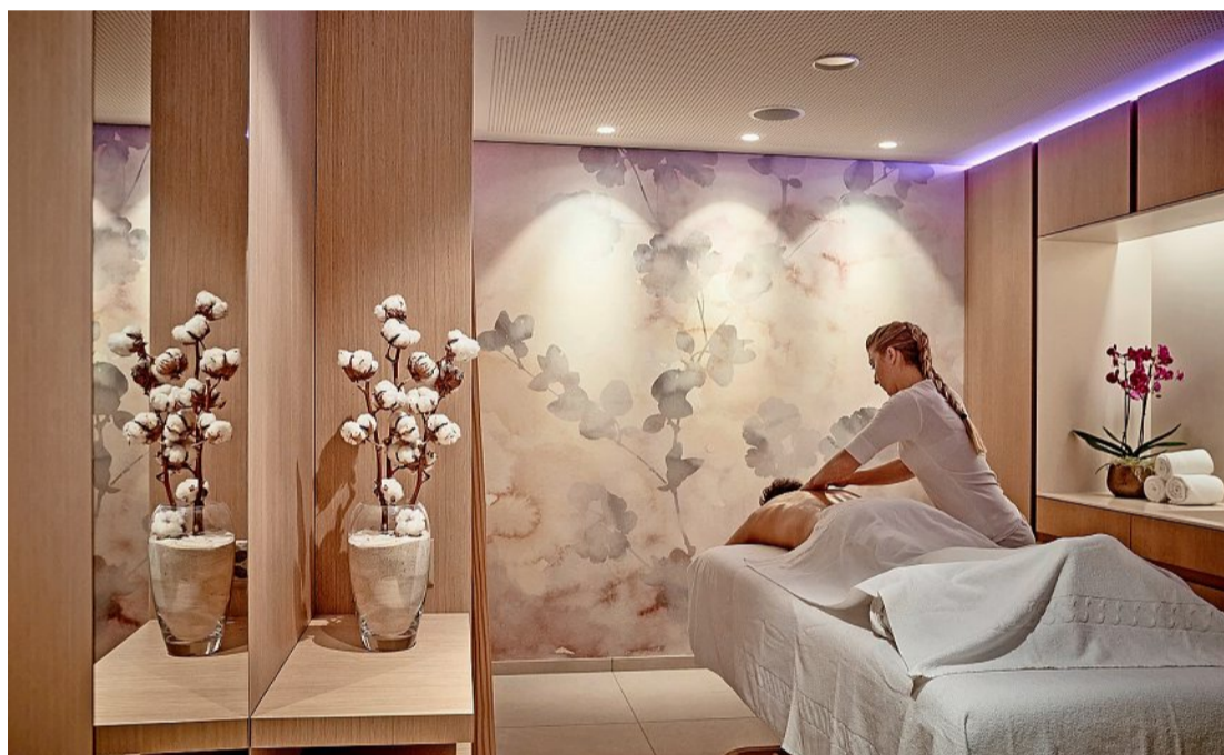
Im Winter setzt das Hotel Eden neben kulinarischen Highlights insbesondere auf Wellness.